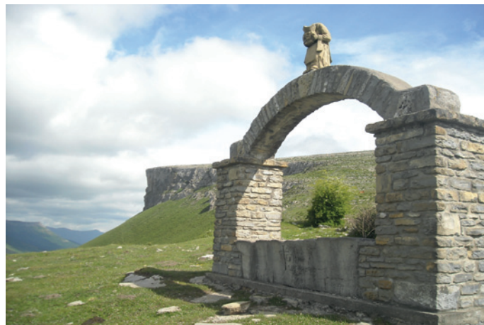
Monumento a San Vitores. Portillo de Aro