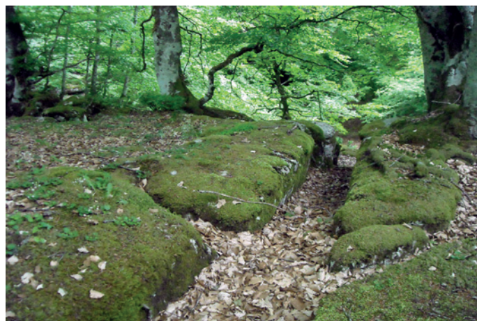
Lapiaz. Sierra Sálvada