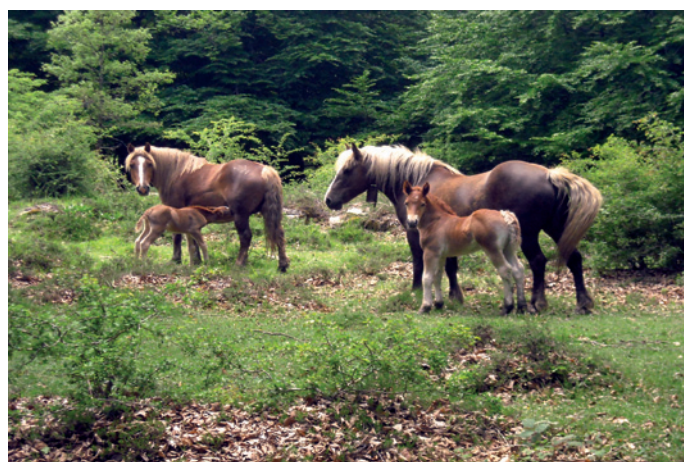
Caballos en Kobata